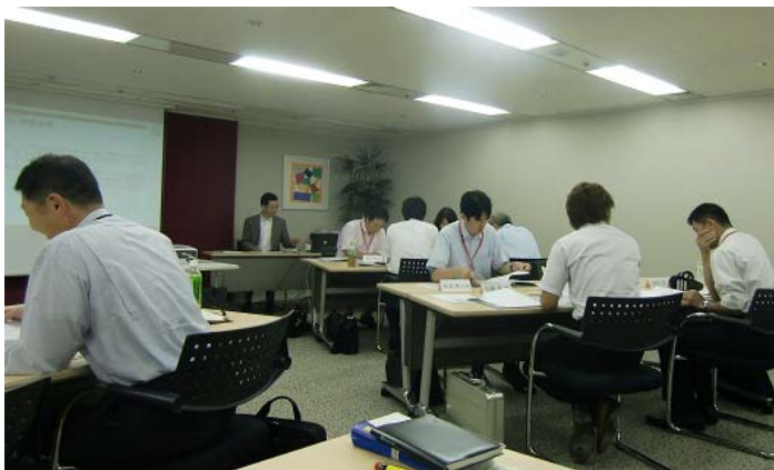
↑本郷人間塾 人財育成スペシャリスト・人間力養成コース 講義の様子